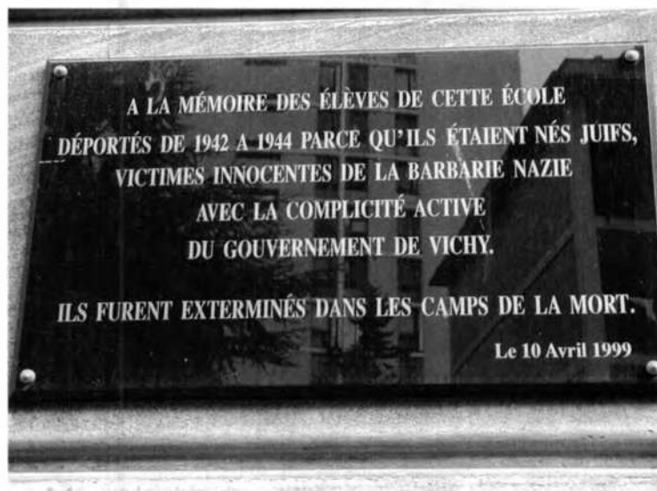
plaque extérieure de l'école Julien Lacroix

Ils furent exterminés dans les camps de la mort.