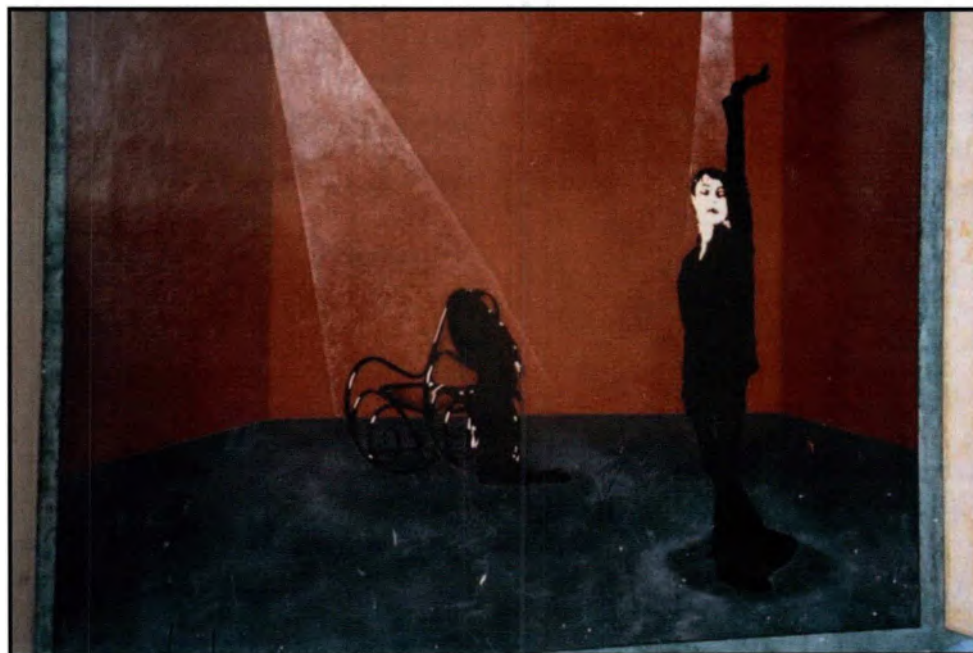
Fresque murale à l'angle des rues Saint-Blaise et Vitruve

La Mairie du XX e a présenté une exposition « Barbara, femme piano », du 19 au 28 novembre 2002.