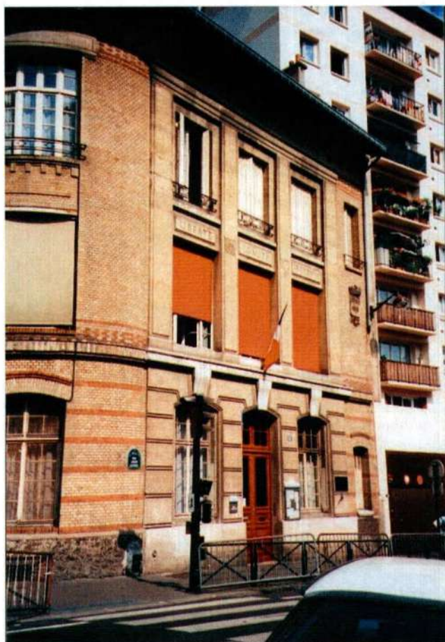
Plaque commémorative à l'extérieur de l'école Julien Lacroix