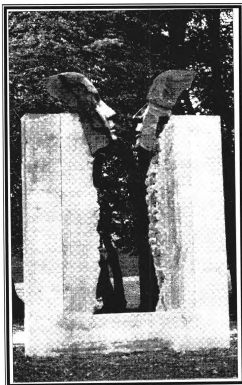
Stèle en l'honneur des étrangers (Besançon).

composition française (sculpteur Jorge Soler)